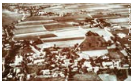
Luftbild des Bauerndorfs Taufkirchen aus dem Jahr 1935

Verantwortungsbewusste Taufkirchner hatten an diesem Tag dafür gesorgt, dass an den Häusern und am Kirchturm weiße Fahnen gehisst wurden. Damit war eine friedliche Übergabe an die amerikanischen Streitkräfte möglich.