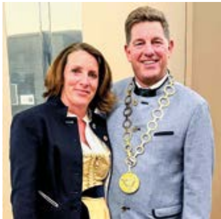
Bürgermeister Ullrich Sander und seine Ehefrau Ruth freuten sich über die zahlreich erschienenen Gäste

Der Einladung des Ersten Bürgermeisters zum Neujahrsempfang Ende Januar folgten auch heuer wieder zahlreiche Gäste aus Wirtschaft, Institutionen und Vereinen Taufkirchens. Auf ein ereignisreiches Jahr konnte Bürgermeister Ullrich Sander zurückblicken.