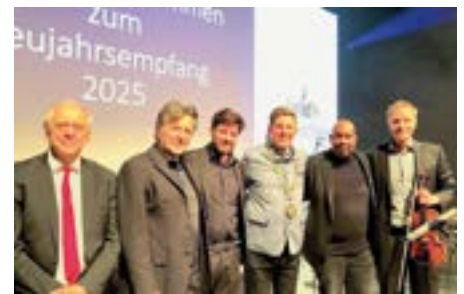
Mitglieder der Musikschule Taufkirchen sorgten für die stimmungsvolle Begleitung des Empfangs

Stolz war Taufkirchens Rathauschef hingegen darauf, dass in Taufkirchen mit seiner Einwohnerzahl von 18.500 über 100 Nationen im Wesentlichen friedlich miteinander leben. Auch positiv stimmte ihn, dass in Taufkirchen entge-